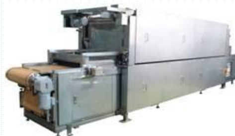
マイクロ波装置コンベアタイプ